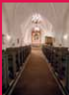
De 9 læsninger