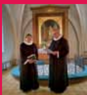
Ny præst indsat