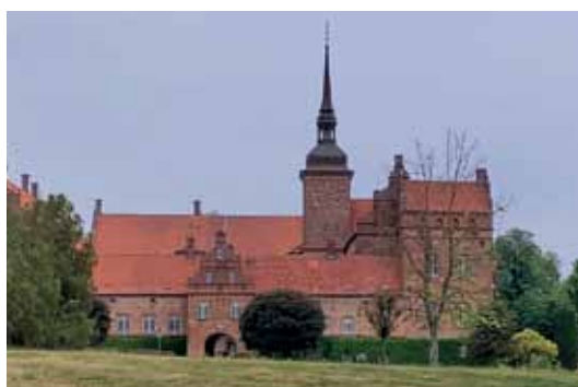
Et af Østfyns mange godser er Holckenhavn syd for Nyborg

Onsdag den 24. maj afsluttede Højskoleeftermiddagene sæsonen med en udflugt til Lolland og Falster. Så er det jo altid spændende, hvad næste vinters tema bliver.