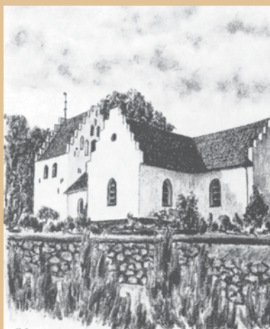
VESTER AABY KIRKE