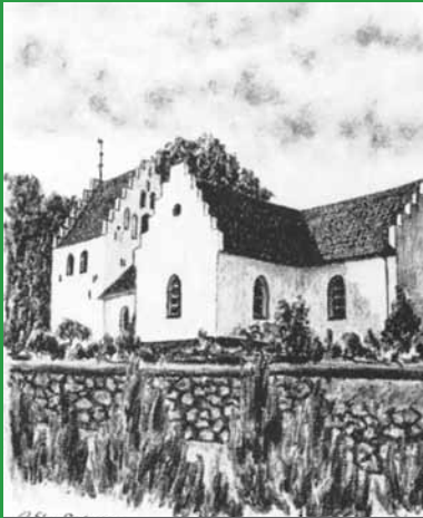
VESTER AABY KIRKE