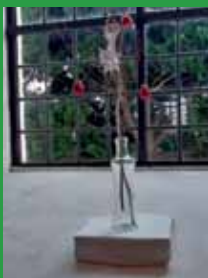
Farver til hverdag