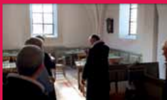
Sideskibet i V. Aaby kirke