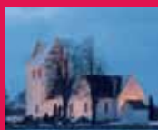
Jul i vore kirker