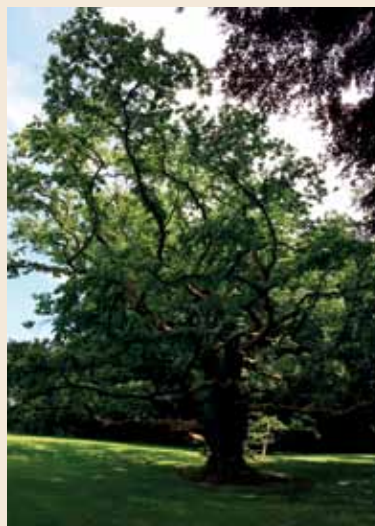
Et af de mest kendte træer i præstegårdshaven er "Hasseltræet".