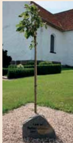
Luthertræet på Vester Aaby Kirkegård – plantet 26. februar 2017.

10.00: Salmemaraton i Aastrup Kirke. Godt 80 mennesker har året igennem mødtes hver anden fredag i en af Faaborg Provstis Kirker og har hørt om kirken og sunget en række salmer fra salmebogen. 8. september er det blevet Aastrup Kirkes tur. Efter vi har sunget serveres der en kop kaffe eller the med lidt brød til.