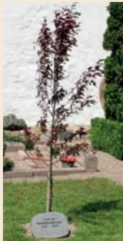
Samme dag fik også Aastrup Kirkegård sit træ.