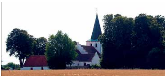
En af de markante ærøske kirker er Rise kirke

Til november begynder Højskoleeftermiddage igen. Denne gang skal vi ikke så langt væk. Det er nemlig Ærø, der bliver vinterens tema. Ærø var sidste gang tema for højskoleeftermiddage i 2001, så denne spændende ø kan vist efterhånden godt tåle en gentagelse.