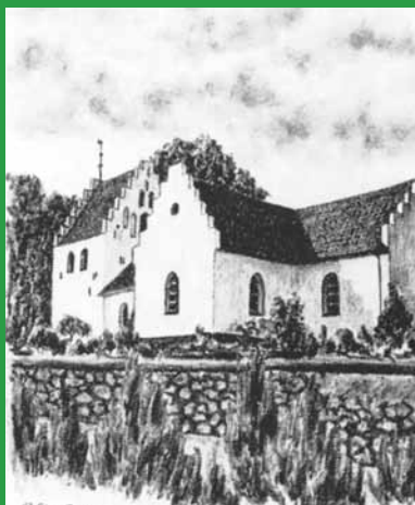
VESTER AABY KIRKE