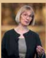
"Trone og trods"